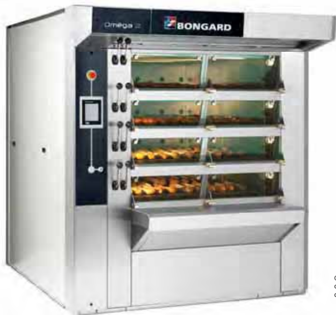
Омега2 602/4.184 - 4 яруса - с опцией скамеечный выступ и с опорными крючками