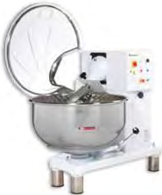
ФБЛ 230 Стандарт с пластиковой крышкой